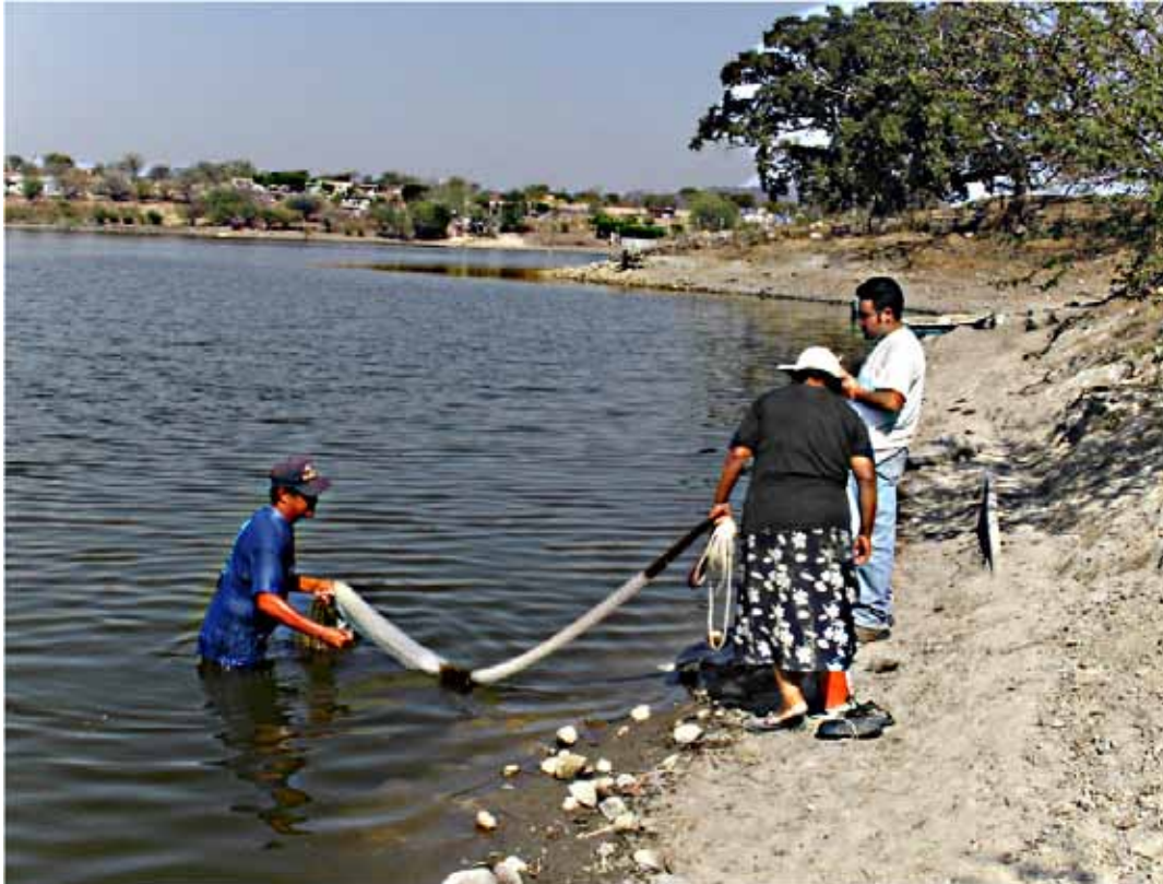
Figura 2. Pesca con atarraya en las micropresas estudiadas.

Se practica la pesca de subsistencia, por personas pertenecientes a las localidades cercanas, y obtienen una cantidad aproximada de 2 a 5 kilogramos por día, y ocasionalmente los fines de semana acuden de otras comunidades a pescar y en el mismo lugar preparan el pescado en caldo o fritos para consumirlos en un día de campo.